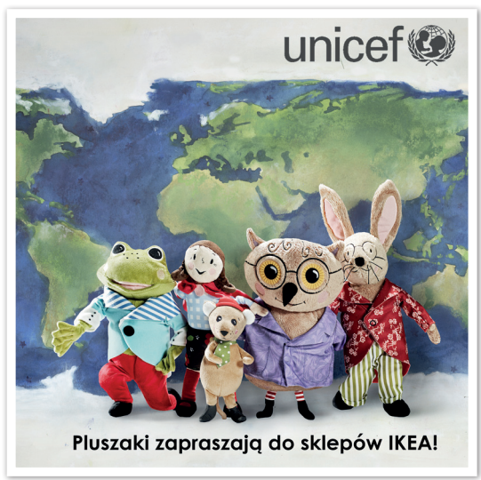
Pluszaki zapraszają do sklepów IKEA!

Właśnie ruszyła kolejna akcja „Pluszaki dla Edukacji”, w ramach której z każdej zakupionej zabawki i książeczki IKEA, 1 euro przeznaczone zostanie na edukację dzieci w najbardziej potrzebnych regionach świata – w Azji, Afryce i Europie Wschodniej.